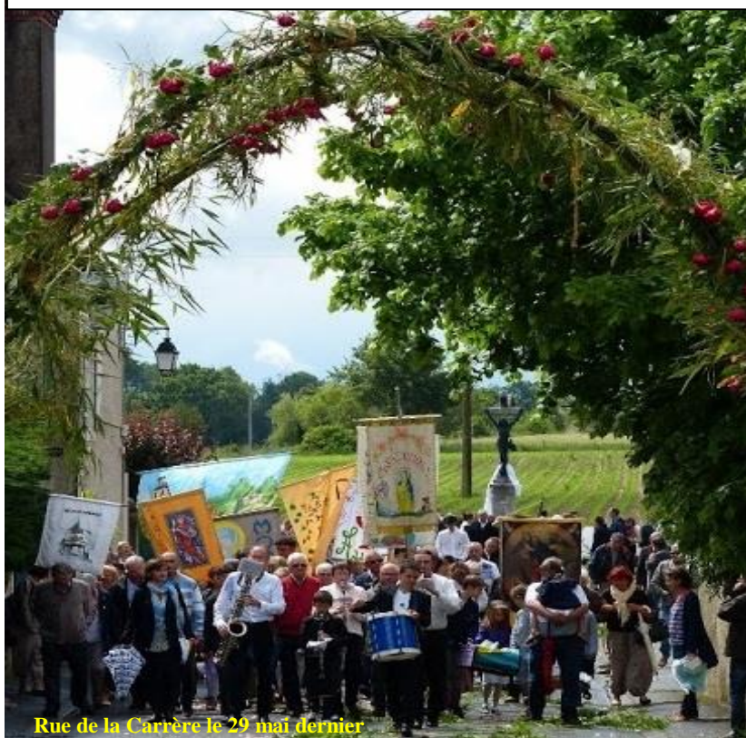
Rue de la Carrère le 29 mai dernier