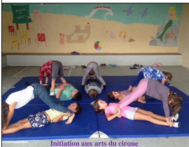
Initiation aux arts du cirque

Si vous êtes intéressés, que vous avez les qualités humaines nécessaires pour travailler avec des enfants et que vous souhaitez aider des professionnels dans l'encadrement, n'hésitez pas à contacter la mairie.