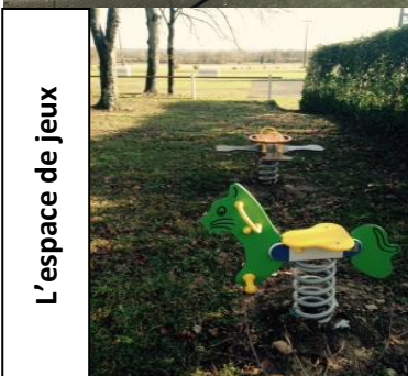
L'espace de jeux

Equipement multi sport ouvert à tous, le City Stade permet la pratique du foot, basket, badminton, tennis, handball ou encore volley.