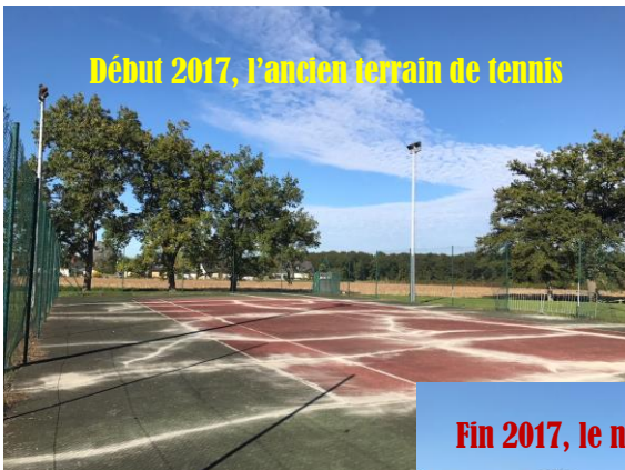
Début 2017, l'ancien terrain de tennis

Ouvert de 6h30 à 20h du lundi au samedi et de 8h à 12h le dimanche