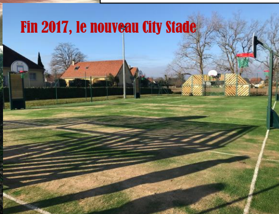
Fin 2017, le nouveau City Stade