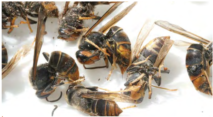
Vespa velutina morts après gavage de nid, La Croix Blanche (Lot-et-Garonne), juillet 2006.

d'une caméra thermique : le frelon agresseur est rapidement entouré d'une masse compacte d'ouvrières qui, en vibrant des ailes, augmentent la température au sein de la boule jusqu'à ce que leur adversaire meure d'hyperthermie (photo) ! Au bout de cinq minutes, la température ayant atteint 45 °C, le frelon succombe mais pas les abeilles, qui sont capables de supporter plus de 50 °C. Cette méthode est très efficace mais, trop souvent répétée, elle entraîne l'affaiblissement de la ruche car les ouvrières consacrent alors moins de temps à l'approvisionnement. En Asie, l'élevage de l'Abeille domestique d'Europe, Apis mellifera , s'est développé progressivement depuis une cinquantaine d'années et cette espèce est désormais largement répandue dans la région. Elle emploie le même moyen de lutte, mais son adaptation au prédateur étant plus récente, sa défense est moins efficace : la boule autocuiseuse d' A. cerana rassemble en effet une fois et demi plus d'ouvrières que celle d' A. mellifera .