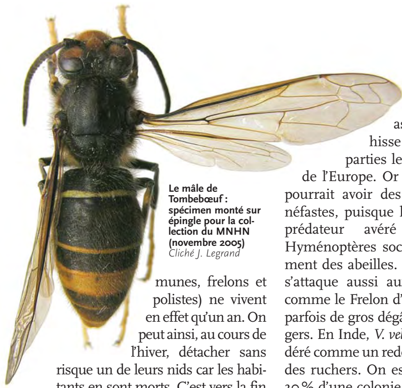
Le mâle de Tombeboeuf : spécimen monté sur épingle pour la collection du MNHN (novembre 2005)

munes, frelons et polistes) ne vivent en effet qu'un an. On peut ainsi, au cours de l'hiver, détacher sans risque un de leurs nids car les habitants en sont morts. C'est vers la fin de l'été que les femelles reproductrices de la nouvelle génération quittent le nid en compagnie des mâles pour s'accoupler ; elles survivront seules à l'hiver tandis que mâles et ouvrières meurent. Au printemps, chaque reine fondatrice ébauchera un nouveau nid, pondra quelques œufs et soignera ses premières larves qui deviendront des ouvrières adultes (femelles stériles) capables de prendre en charge la construction du nid et l'entretien de la colonie.