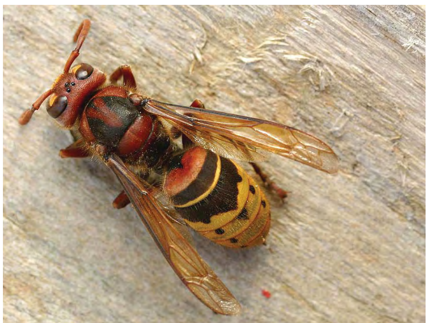
Le Frelon européen Vespa crabro - © Entomart à http://home.tiscali.be/entomart.ins/

mais exceptionnellement, dans les creux de murailles ou dans une cavité du sol. Le plus souvent, il façonne son nid dans la frondaison des grands arbres, et on ne le repère alors qu'au bruit produit par les allées et venues des ouvrières dans le feuillage (mais, aux dires de nombreux observateurs, il se déplace en vol beaucoup plus discrètement que le Frelon d'Europe) ou seulement en automne lorsque l'arbre a perdu ses feuilles. Lorsqu'il s'installe dans un espace bien dégagé (habitation, arbre au port étalé), le Frelon asiatique est un artiste qui façonne un magnifique nid de papier dont la forme, quasiment circulaire, est très caractéristique. La paroi du nid, formée de larges écailles de papier striées de beige et de brun, est très fragile. Le diamètre