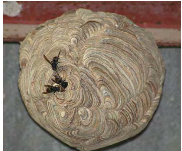
Nid parfaitement sphérique du Frelon asiatique installé sous un toit à Bourrant (Lot-et-Garonne), août 2006