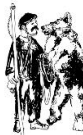
Haut Conseil à l'Education Artistique

#1 / lundi 9 juillet dessin d'observation, les proportions.