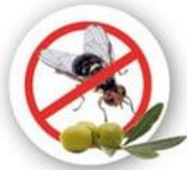
Mouches des oliviers Bactrocera oleae