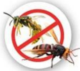
Guêpes et Frelons