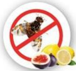
Mouches des fruits Ceratitis capitata