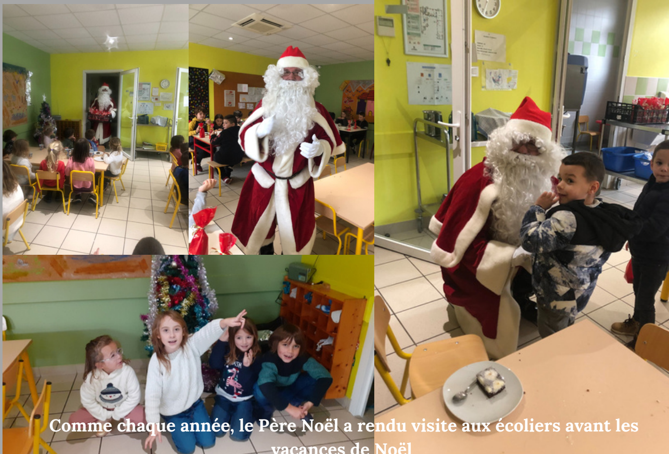
Comme chaque année, le Père Noël a rendu visite aux écoliers avant les vacances de Noël