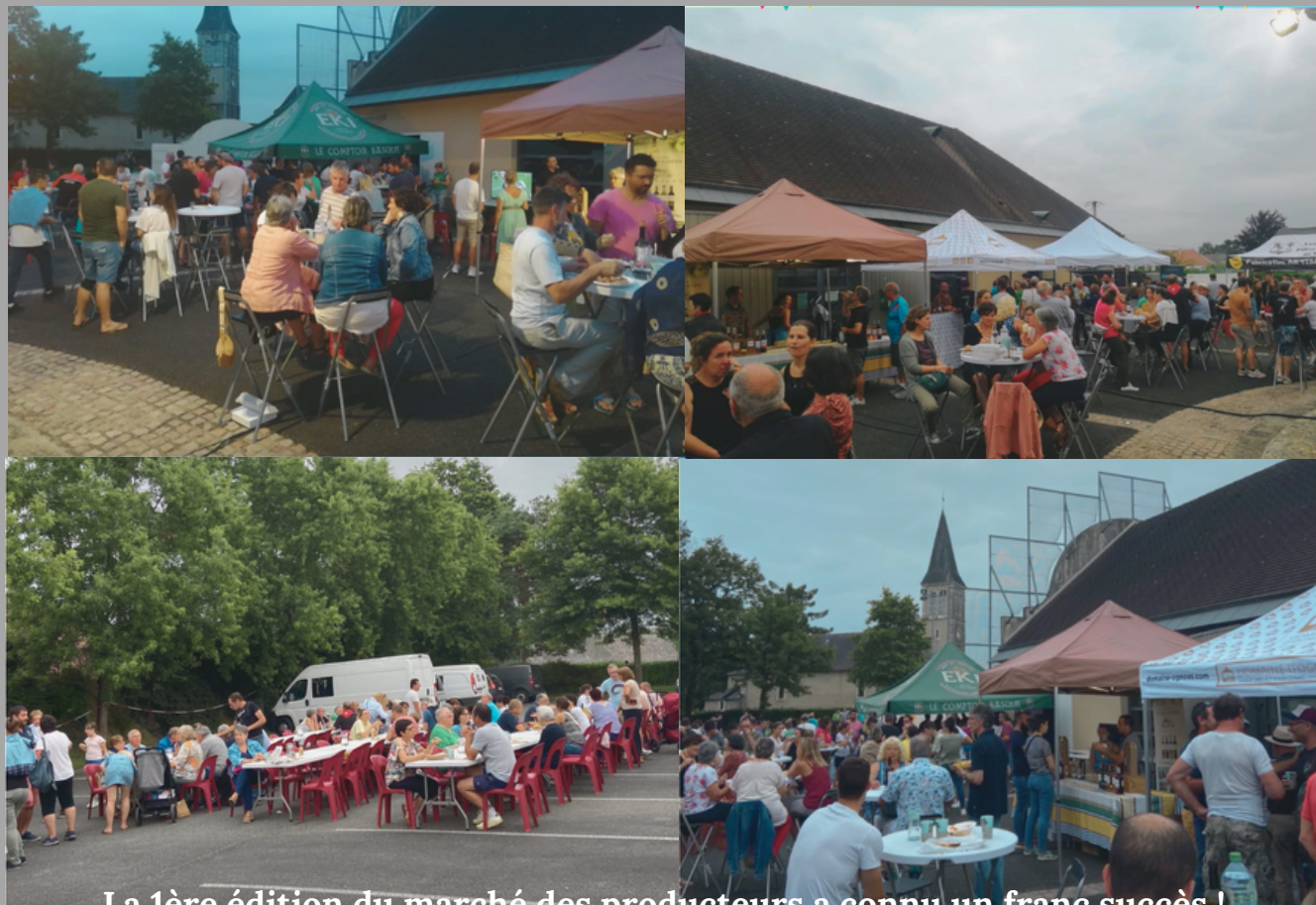
La 1ère édition du marché des producteurs a connu un franc succès !